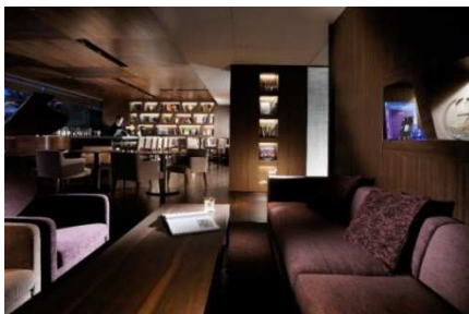
ライブラリー&バー