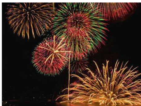
みなとまつり花火イメージ