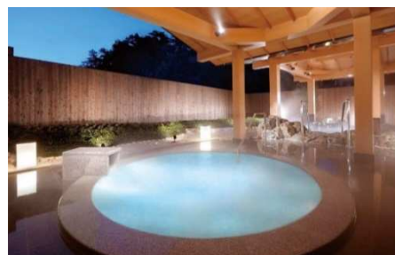
パールオーロラ風呂