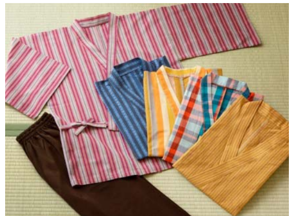
伊勢木綿のくつろぎ着