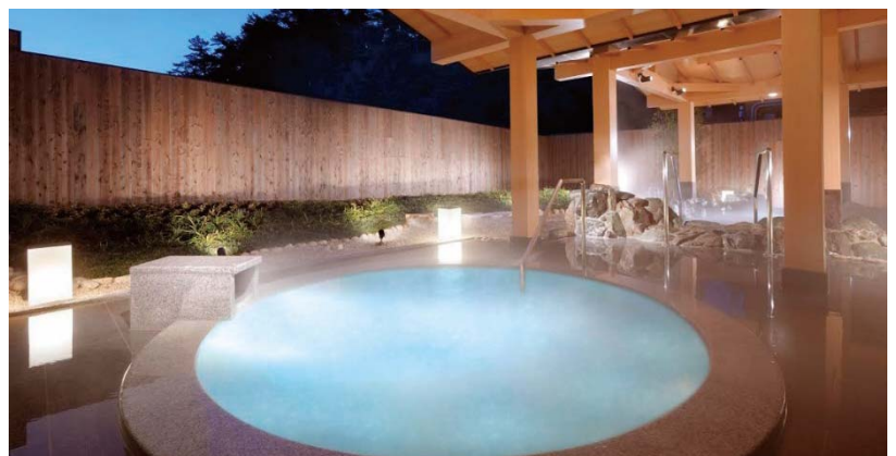
パールオーロラ風呂