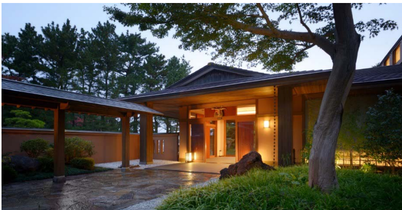
和風旅館 潮路亭 外観