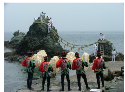
夫婦岩の注連縄張神事