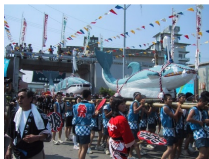
相差天王くじら祭り