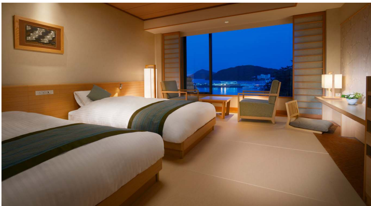
伊勢木綿のベツスローやクッションでしつらえた和モダンツイン

京都の有名老舗旅館の布団を手掛けている大手寝具メーカー「株式会社丸八ホールディングス」と、こだわりぬいて共同開発した高級寝具により、布団ならではの良さを再発見できる「至福の眠り」を体感していただけます。また、内装には伊勢木綿や伊勢型紙などをしつらえ、三重の歴史・文化に触れる滞在をご提供いたします。