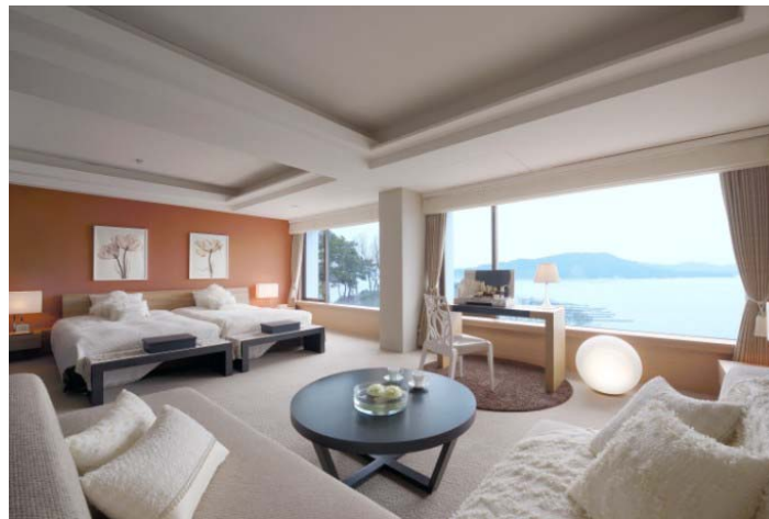
ミキモトコンセプトルーム「パール・スイート」(56㎡)

“真珠の海”鳥羽湾の絶景をお楽しみいただける「オーシャンビュー・スイート」(56㎡)を、ミキモトコンセプトルームとしてアレンジした「パール・スイート」のお部屋を、新郎新婦のご結婚式前日、または当日のご宿泊にご用意いたします(1泊朝食付き、※1日1組限定・先着順とさせていただきます)。真珠をイメージした照明やオブジェなどでアレンジされたお部屋には、ミキモト製の置時計やボールペンなどの真珠をあしらった小物、特製バスローブやタオルなどをそろえております。