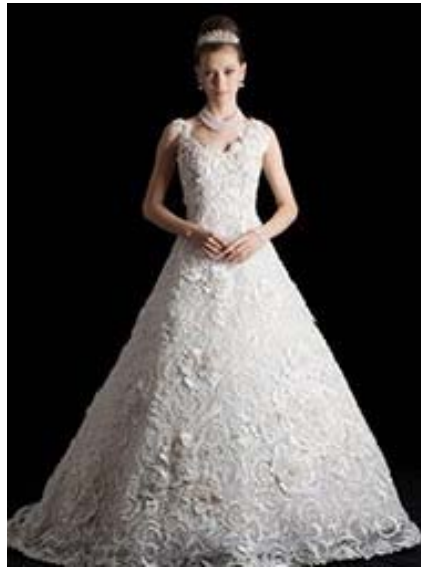
ギネス登録の真珠ドレス “Princess of MIKIMOTO Pearls”

ミキモトの貴重なティアラやジュエリーなどのレンタルをご用意いたします。また、平成 26 年 8 月 24 日（日）のブライダルフェアにて展示する、桂由美氏デザイン・制作による、アコヤ真珠 13,262 個を刺繍したウェディングドレス、YUMI MARIÉE “Princess of MIKIMOTO Pearls” のレンタルもご利用いただけます。当ドレスは、「世界最多の真珠を付けたウェディングドレス」として、ギネス・ワールドレコードにも登録されています。（レンタル価格：¥2,700,000（税込）、※ワンサイズのみのご用意となります。）