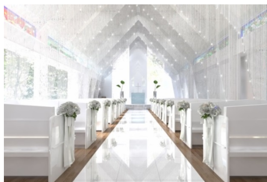
チャペル内装（イメージ）