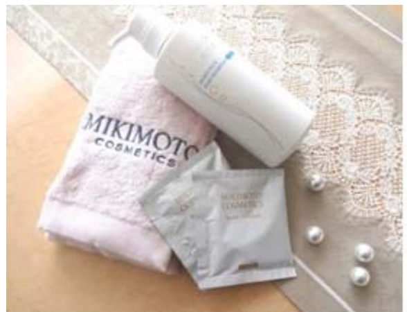
ミキモト インターナショナルのギフト（イメージ）