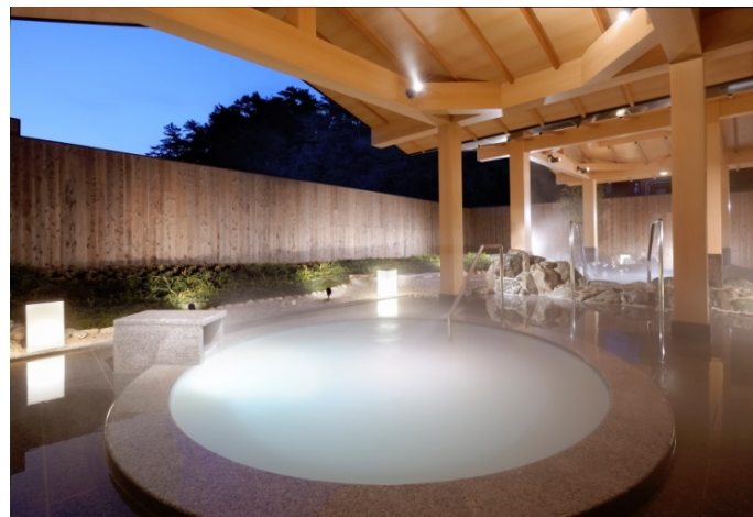
潮路亭 パールオーロラ風呂

また、別館の潮路亭に平成24年に誕生した「パールオーロラ風呂」にもご入浴いただけます。真珠由来成分を配合したパールオーロラ風呂は、真珠とアコヤ貝からしか抽出できない希少な真珠の恵み(真珠コンキオリン・ピュアパールミネラル・パールコラーゲン)により、真珠のように輝く肌“真珠肌”へと導きます。ご結婚式前後にゆったりとお体を休めていただけます。