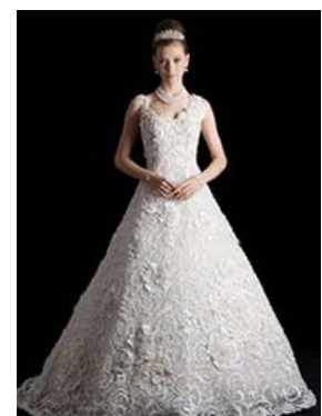
ギネス登録の真珠ドレス “Princess of MIKIMOTO Pearls”